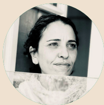
לילך לב ليلك ليف

ניהול וליווי פדגוגי الادارة والمرافقة التربوية