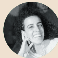
כרמל איל كرميل إيل