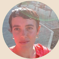
כנרת נעם كنيرت نعام

תומכת-מחנכת כיתה א' مساعدة-مربية الصف الأول