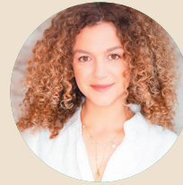
שרה פנה רייפשונידר קורן سارة بنا رايفشنايدر كورين

ניהול וליווי פדגוגי الإدارة والمرافقة التربوية